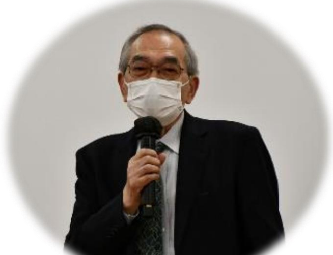
東京亀城会 元木会長挨拶

日曜日にも関わらず、母校の公式行事として在校生、教職員約500名もの方々が、寄贈された大型スクリーンを通じてライブ視聴してくれました。在京OBと現役が、素晴らしい講演・トークショーの感動と興奮を共有するという、なんとも「幸せ」な一時を経験することが出来ました。心から感謝します。