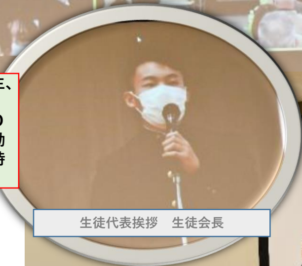
生徒代表挨拶 生徒会長

日曜日にも関わらず、母校の公式行事として在校生、教職員約500名もの方々が、寄贈された大型スクリーンを通じてライブ視聴してくれました。在京OBと現役が、素晴らしい講演・トークショーの感動と興奮を共有するという、なんとも「幸せ」な一時を経験することが出来ました。心から感謝します。